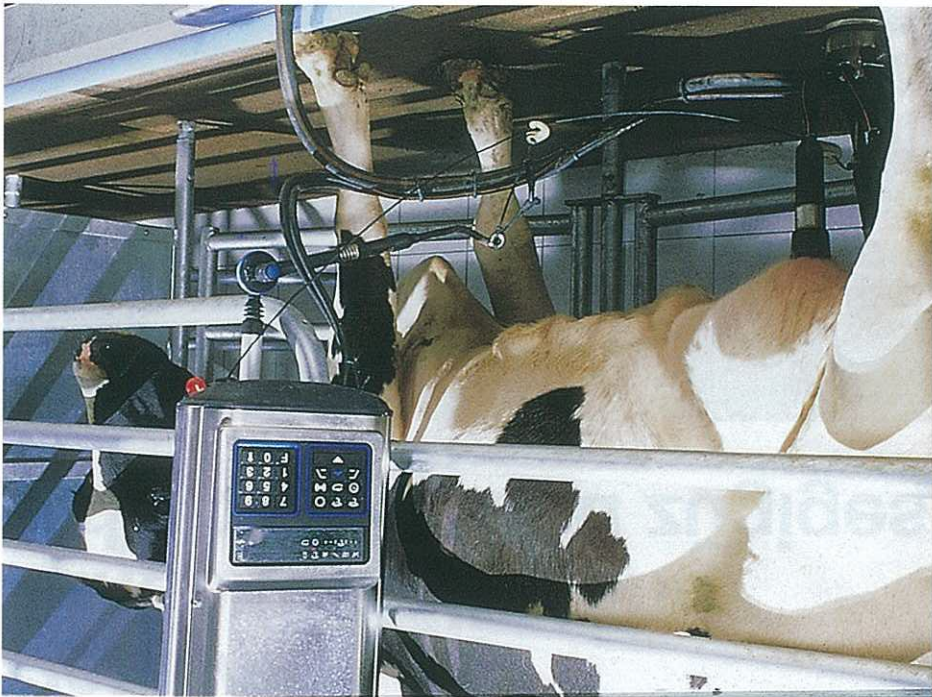
Das bietet nur Tandem: Die ganze Kuh im Blick.